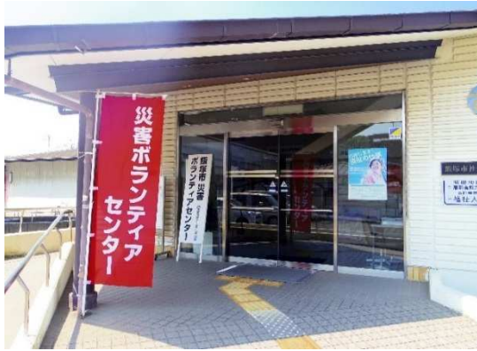
災害ボランティアセンター玄関