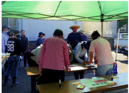
ボランティア受付